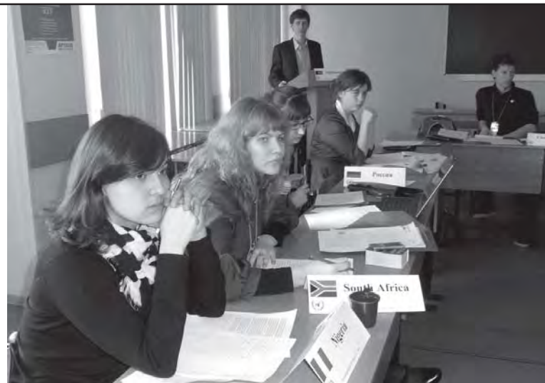
Совет Безопасности обсуждает проблемы Афганистана

В качестве темы для обсуждения была предложена ситуация в Афганистане. Многие десятилетия в этой стране идет непрекращающийся вооруженный конфликт, который давно вышел за пределы национальных границ. Именно поэтому Афганистан по-прежнему приковывает