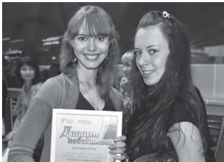
Представительницы Южно-Уральского университета, награжденные за активное участие в форуме