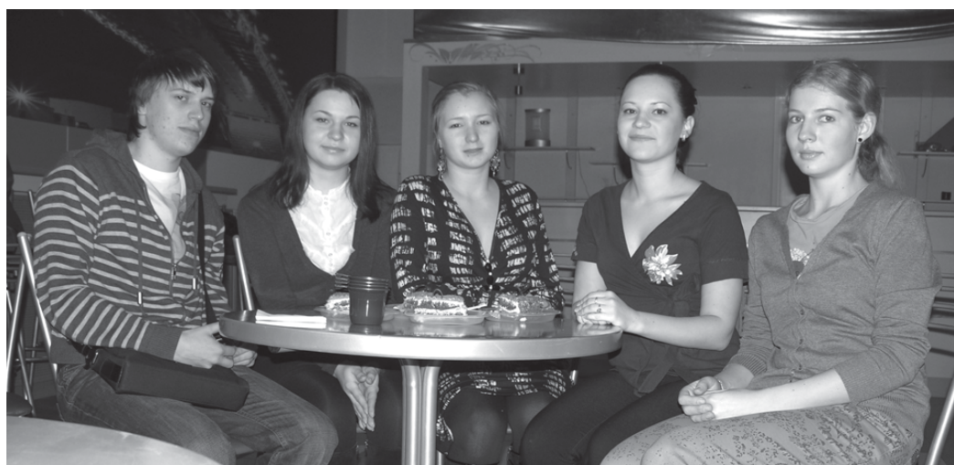
Дружная команда создателей фильма «Всемогущий менеджмент»

И, завершая наш рассказ, необходимо сказать, что выпуском диска, содержащего видеорассказы студентов о своих будущих профессиях, эта работа закончена не будет. Совсем скоро аналогичный конкурс будет объявлен для старшеклассников всей области – пусть тоже пофантазируют на темы о том, как они представляют профессию, которые намерены постигать, когда станут студентами нашего университета.