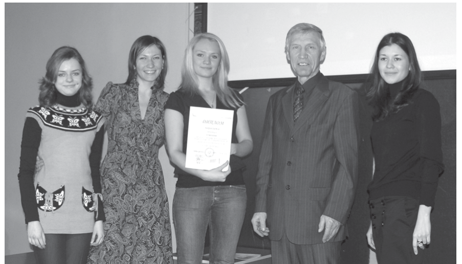
Диплом получают создатели сценария о профессии социолога

Но даже в виде «черновых» кинопроб показанное весьма впечатляет. Сколько в этих коротких – ну, шедеврах не шедеврах, но безусловно интересных работах – изобретательности, юмора, доброй фантазии!